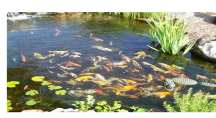
景观池或蓄水池等水体内可养鱼类进行灭蚊