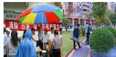
社区积极开展集中统一除四害活动