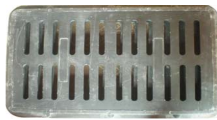
下水道有老鼠时，可在下水道内挂放蜡块毒饵灭鼠