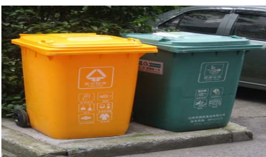
垃圾做到日产日清，收集容器保持密闭