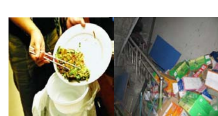
收藏好食物，管理好水源，清理四害孳生场所，及时倾倒垃圾，让四害无处藏身