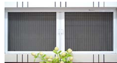
安装纱门纱窗，防止蚊、蝇进入