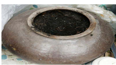
不用生肥养花种菜，对已长蝇蛆的可用甲基嘧啶磷杀灭