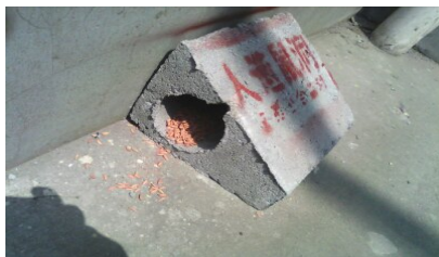
如有鼠患，靠墙布毒饵站灭鼠