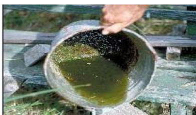
翻盆倒罐，清除积水