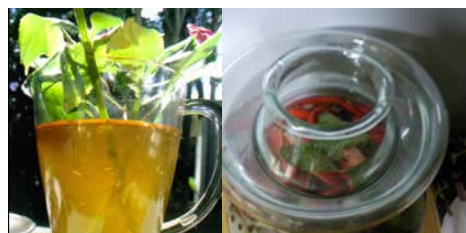
室内不存积水，每周检查养花水和腌菜罐，发现水中孳生蚊虫彻底换水；不能换水的，可购买投放微生物灭蚊剂或加盖密闭