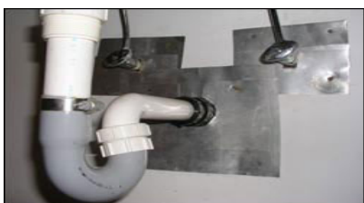
墙上的孔洞用硬物封闭（或堵塞），防止老鼠进入