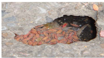
有鼠洞的地方，在鼠洞内投放鼠药灭鼠，再进行封堵