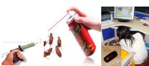
聚集在水池下、灶台下的缝隙处的蟑螂可选用灭蟑气雾剂或胶饵进行杀灭，同时做好室内卫生，及时清除卵鞘，减少蟑螂孳生