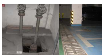
地下停车场积水池、水沟等不易清理的积水可选用安倍砂等灭蚊